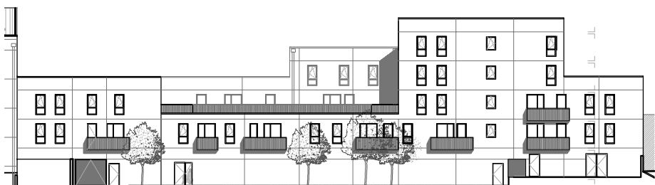
Repérage - Façade arrière