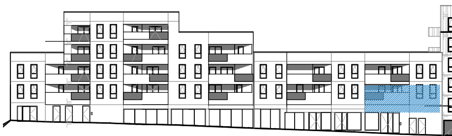
Repérage - Façade avant