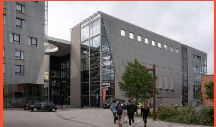
ARTFX ET OPALIA – Campus ARTFX (effets spéciaux) : école, studios de tournage, résidence étudiante, incubateur (livraison été 2023)