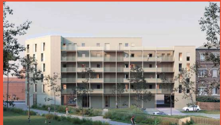
VILLE RENOUVELEE / IDÉEL – Programme de 33 logements et 1 cellule commerciale (livraison fin 2026)