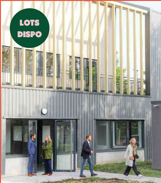
SPIRIT – Village d'entreprises : 9 000m 2 d'ateliers et bureaux pour TPE/PME 1 er bâtiment livré en septembre 2024