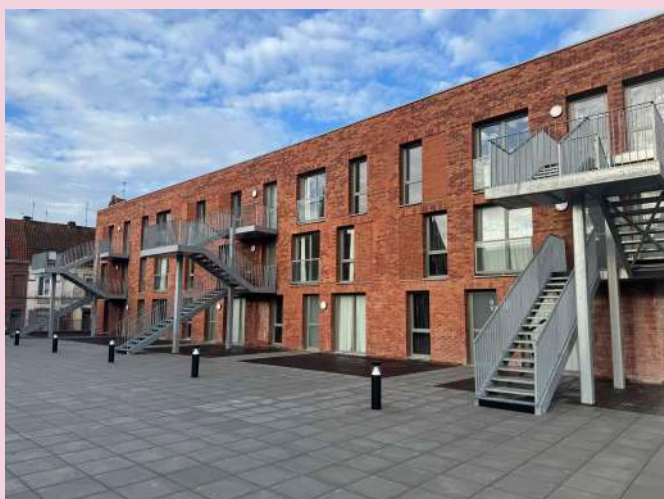
Résidence Résid'Up / Afev (bâtiment B)