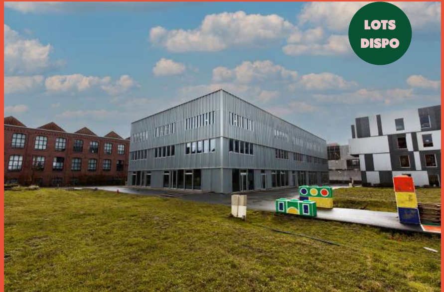
VILLE RENOUVÉE – Programme de bureaux «Smart» (livré à l'été 2023)