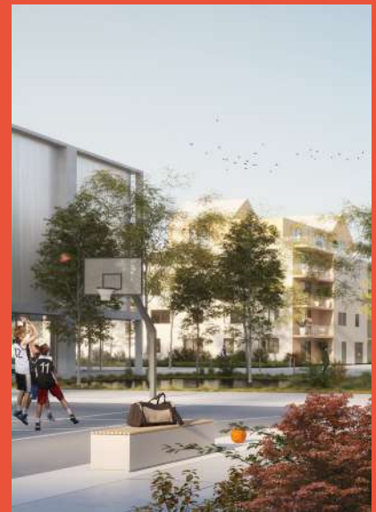
PROJET TERKEN – Programme pour un restaurant, des logements, une école, des commerces, un parking sur le site de l'ancienne brasserie Terken (études en cours). Images non contractuelles