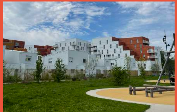
ICADE PROMOTION Programme de 223 logements «Cime et Parc» (livraison juillet 2023)