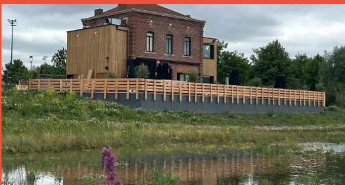
VILLE RENOUVÉE – Parc marais fréquenté (livraison hors espaces verts août 2025)