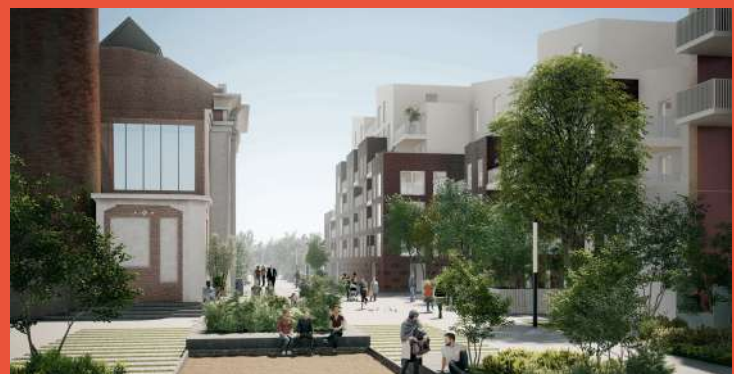
VILLE RENOUVÉE – Cours du Peignage (livraison 2025)