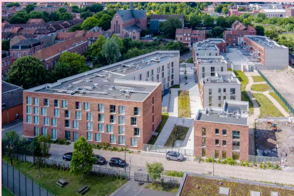
Salles communes Arpej (life place et workplace)