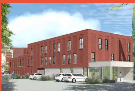
MATIM ET AFEJI – Foyer pour jeunes femmes (livraison en 2025)