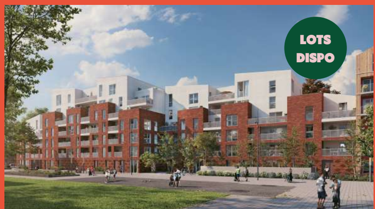
NACARAT – Programme de 85 logements et 1 cellule commerciale de 185 m 2 (livraison en 2026)