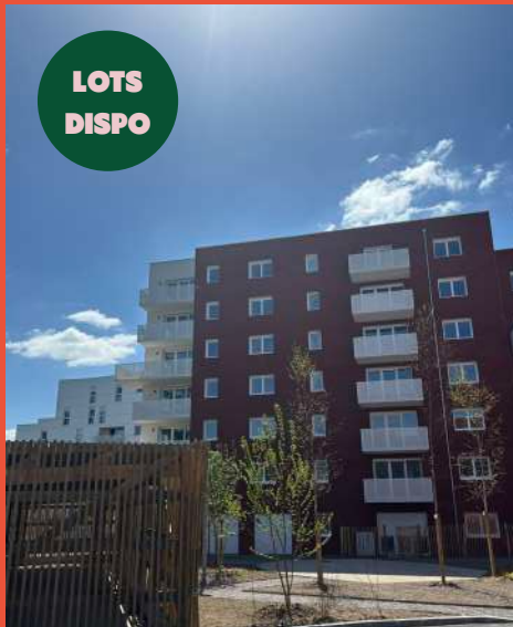
CARRERE – Programme de 141 logements «Nouvel'Aire» (livraison septembre 2025)