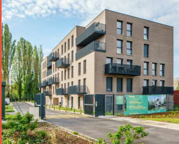
PROMOGIM – Programme de 70 logements «Villa Factory» (livraison juillet 2024)

Cela démontre la dynamique de l'Union, qui atteindra à terme 3 600 habitants, 6 000 salariés et 10 hectares d'espaces verts.