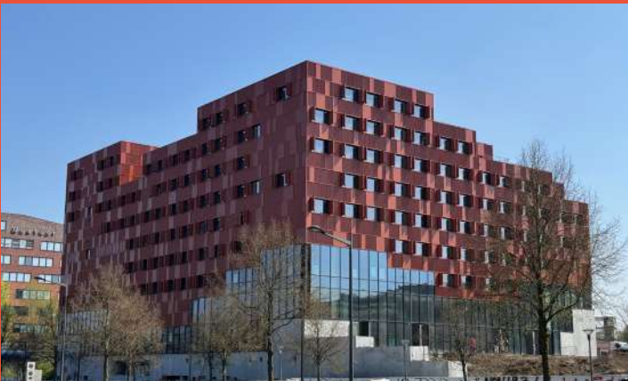
IDÉEL – Campus sport : arena, centre de formation, espace jeux vidéo, résidence étudiante (livraison septembre 2025)