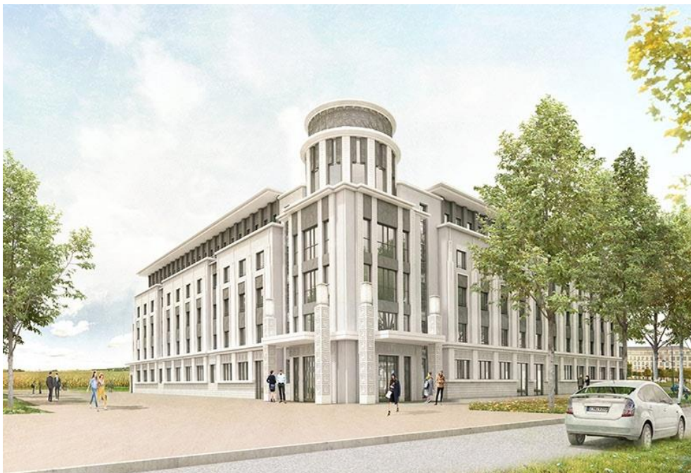
Résidence George GERSHWIN & Résidence Duke ELLINGTON – CHESSY

Sur une parcelle de 2844 m 2 , les 2 résidences à l'architecture Art-Déco viennent compléter l'offre de logements sur ce secteur en plein dynamisme et bien desservi par les transports. Elles s'inscrivent dans une démarche responsable en répondant aux normes de construction de la certification H&E (Habitat et Environnement).